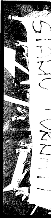
Festa Veni tifosi di basket forlivesi celebrano la promozione in Lega2

LA VOCE - VENEZIANI '23 OGGI 2010 Oggi in città Jail Tour 2010: promuove l'economia carceraria d'Italia